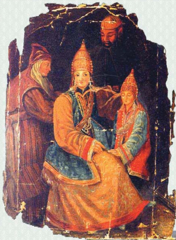
Билгесез рэссам. Сөембикэ ханбикэ улы Үтәмешгарэй белән. Парсуна. XVII йөз башы.