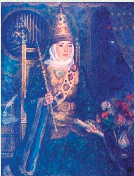
Искәндәр Рафыйков. Сөембикә тәхеттә. 1999

Сөембикәнең туган жире – Нугай урдасы, XV йөз башында Алтын Урда таркалганнан соң барлыкка килгән дәүләт. Ул Казан һәм Себер ханлыктарынан көньякка таба Идел һәм Иртыш елгалары арасындагы далаларның зур өлешен алып тора. Илдә урнашкан тәртип буенча, нугай халкында ханнар булмый. Илдәге иң зур түрә булып бәк исәпләнә. Муса бәкнең олы улы Йосыф Жаек (хәзерге Урал) елгасының көнчыгышындагы жирләрдә морзалык итә. Сөембикә исә – Йосыф морзаның бердәнбер һәм өзелеп яраткан кызы. Аларның нәсел тармагы Идегәй токомына барып тоташа. Тарихи документларда Сөембикәнең туган елы күрсәтелмәү сәбәпле, аның кайчан туган икәнлегенә төгәл җавап юк. Мәшһүр тарихчы, Сөембикә турында махсус хезмәт язган һади Атласи ханбикәнең туган елы да, үлгән елы